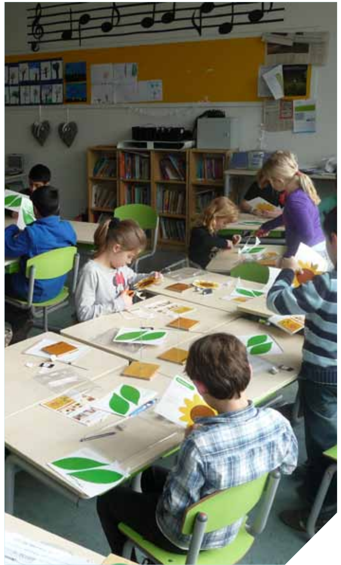
Energie op de Sterrenschool in Kerschoten, Apeldoorn

Om zeker te weten hoe en dat koploperprojecten tot uitvoering komen, moeten bindende afspraken worden gemaakt met alle bij dat project betrokken partijen. Dit kunnen mondelinge afspraken zijn, maar bij voorkeur worden ze vastgelegd in een overeenkomst of een ander document. De energieregisseur kan hierbij een sleutelrol vervullen. Projecten die succesvol zijn uitgevoerd leiden weer tot meer vertrouwen en bewustwording. Verder bouwen aan nieuwe initiatieven wordt dan steeds makkelijker.